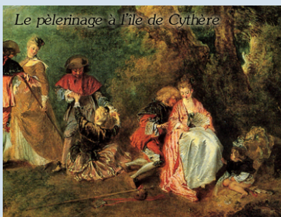
Le pèlerinage à l'île de Cythère